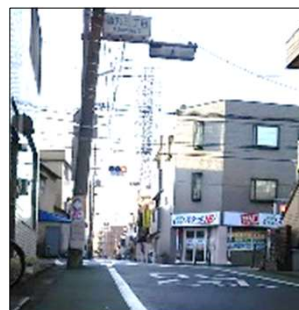
徳丸三丁目交差点