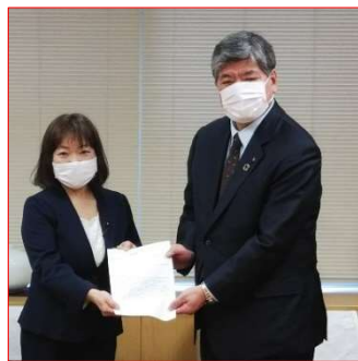
区長へ要望書の提出

車いすを避難所の備蓄品に準備してもらえようように無所属の会として区長へ提出いたしました。