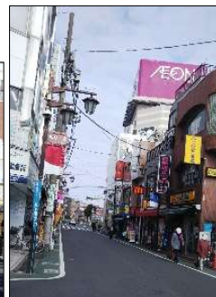
東武練馬駅前商店街