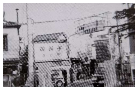
昭和41年 下赤塚公開堂通り商店街