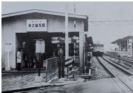
昭和45年ごろの「東武練馬駅」

昔の写真をみて、少しの間タイムスリップしてみませんか？懐かしく思う方、新しく感じる方々が写真をとって「つながる」瞬間かもしれません。