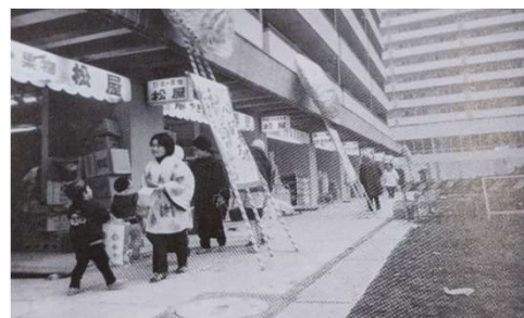
昭和47年 高島平駅前中央商店街