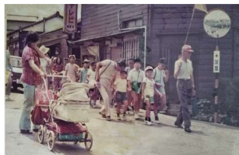
昭和の地域の遠足 この頃は乳母車(現在はベビーカー)の親子も参加