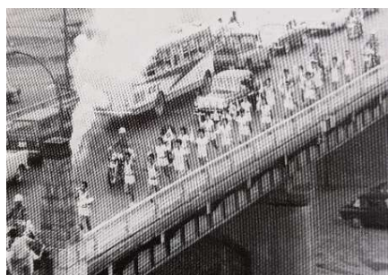
昭和39年 東京オリンピック聖火リレー リハーサル(戸田橋)