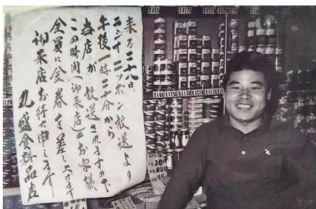
昭和43年 北野マーケット 丸盛食料品店の貼り紙が時代を物語る