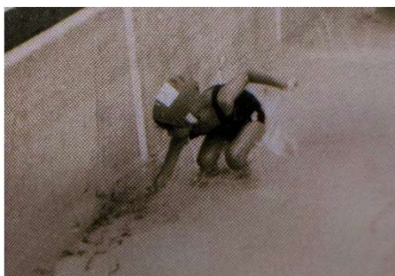
昭和50年代 紅梅小学校「金魚つかみ大会」